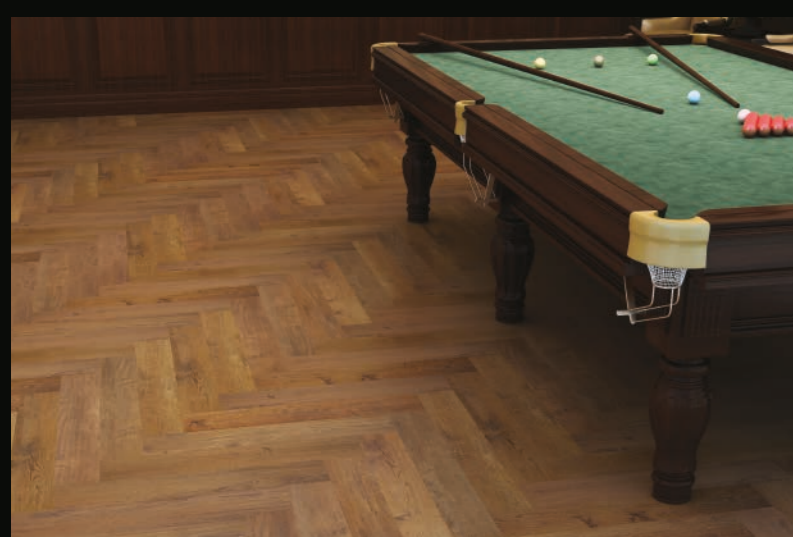
ISOCORE 6.5 / IC1116522509