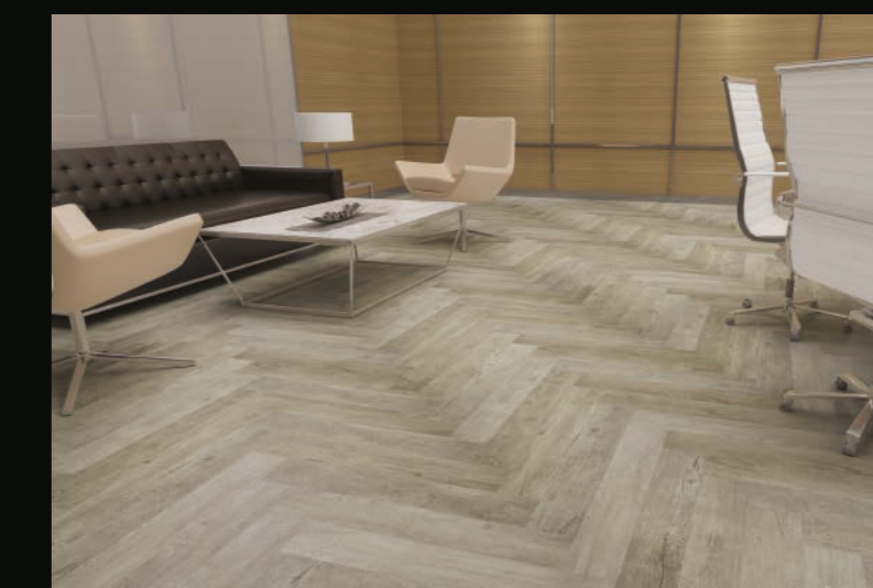
ISOCORE 6.5 / IC1116522506