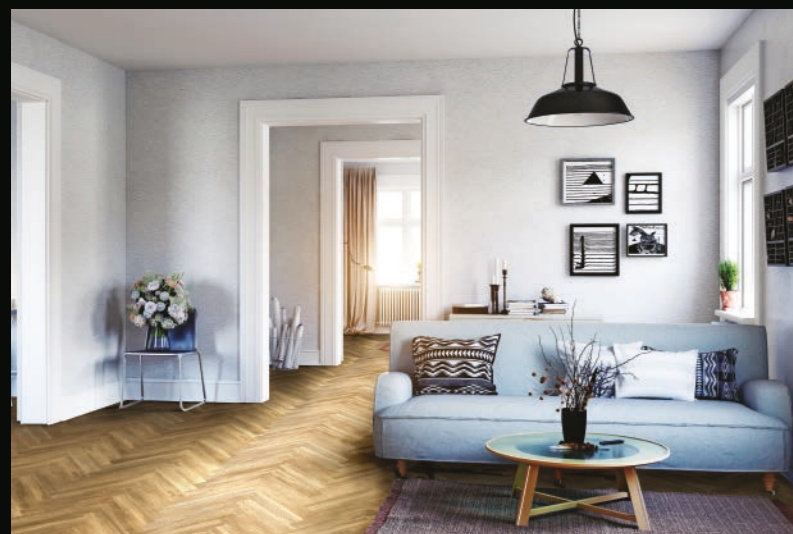
ISOCORE 6.5 / IC11165433