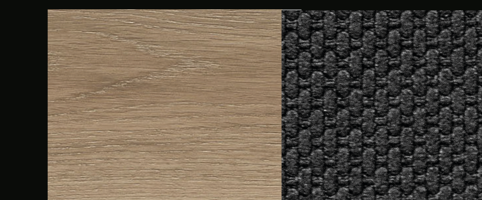
ISOCORE CLICK BACKSIDE