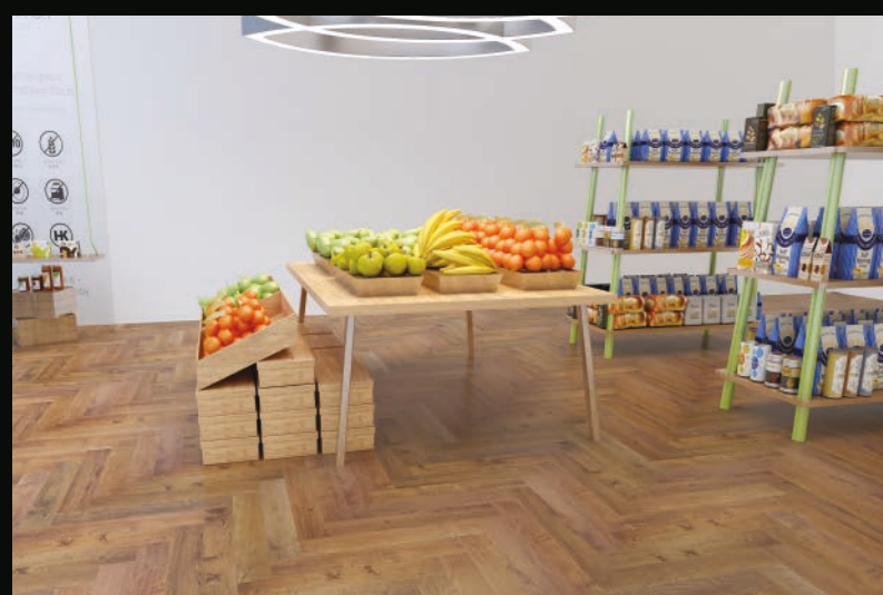
ISOCORE 6.5 / IC1116522502