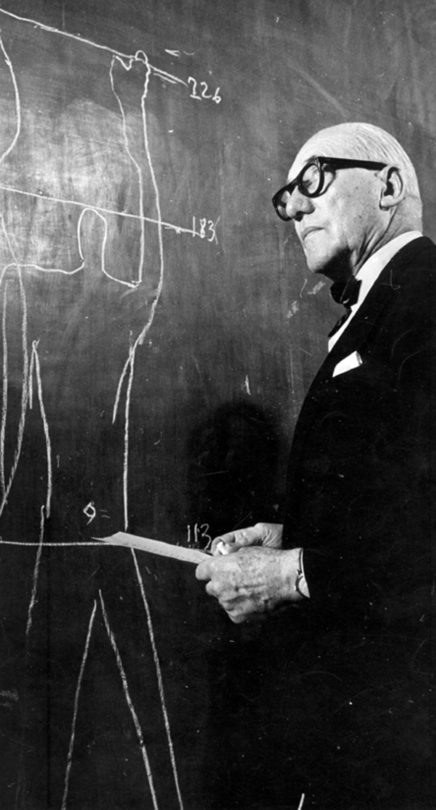
© LCS-ADAGP - PROLITTERIS - Le Corbusier